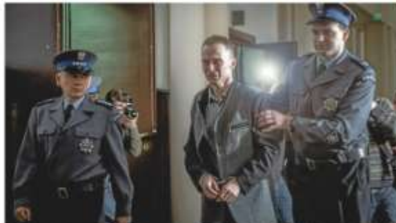
Der Träger des Preises im Wettbewerb Braunschweiger und Bremer ist ebenfalls ein polnischer "Newtop" Sagartha "25 Years of Innocence".

09.11.2021 19:47 Lesedauer: 2 Minuten Thomas Grottel